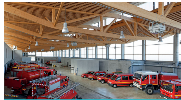
Caserne de pompier en bois. Architecte : Thierry Van de Wyngaert.

Lors d'un incendie, l'acier se déforme et le béton cède, contrairement au bois qui garde ses propriétés mécaniques.